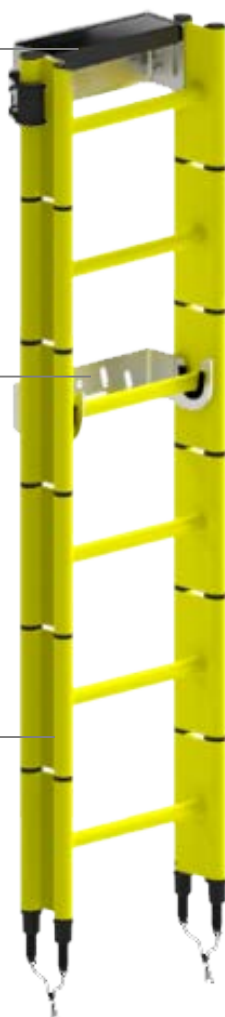
Modules en PP moulés