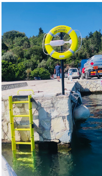
LightUnit avec panneau solaire intégré